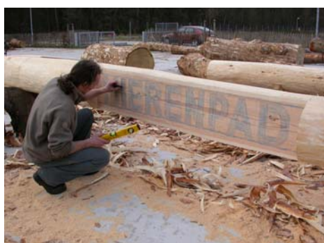
Ivan in actie !

niet bruikbaar omdat ze ‘ring’ (scheur die de jaarringen volgt) zijn. Voor de constructies (brugjes, een knuppelpad, ...) wordt gebruik gemaakt van verschillende houtsoorten zodat de duurzaamheid ervan vergeleken kan worden.