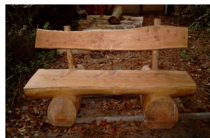
Met de kettingzaag gemaakte bank

Bij het betreden van het Mierenpad ontvangt ieder die wil een in te vullen vragenlijst over het leerpad. De winnaar ervan wordt de eigenaar van een met de kettingzaag gemaakte Kempens tuinmeubel. Tot 30 september 2005 heeft men de kans om hieraan deel te nemen ! Waag uw kans en leer op een aangename manier over duurzaam bosbeheer !