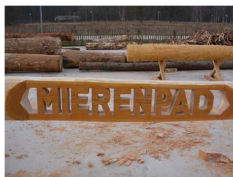
Mooi afgewerkt !

niet bruikbaar omdat ze ‘ring’ (scheur die de jaarringen volgt) zijn. Voor de constructies (brugjes, een knuppelpad, ...) wordt gebruik gemaakt van verschillende houtsoorten zodat de duurzaamheid ervan vergeleken kan worden.